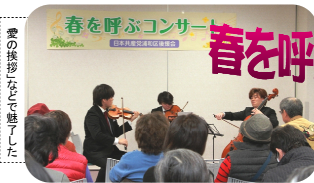
愛の挨拶などで魅了した

日本共産党浦和区後援会ニュース 2018年3月号・No.81 浦和区北浦和3-14-16 TEL/FAX 048-833-4515 ***** (部内資料) *****